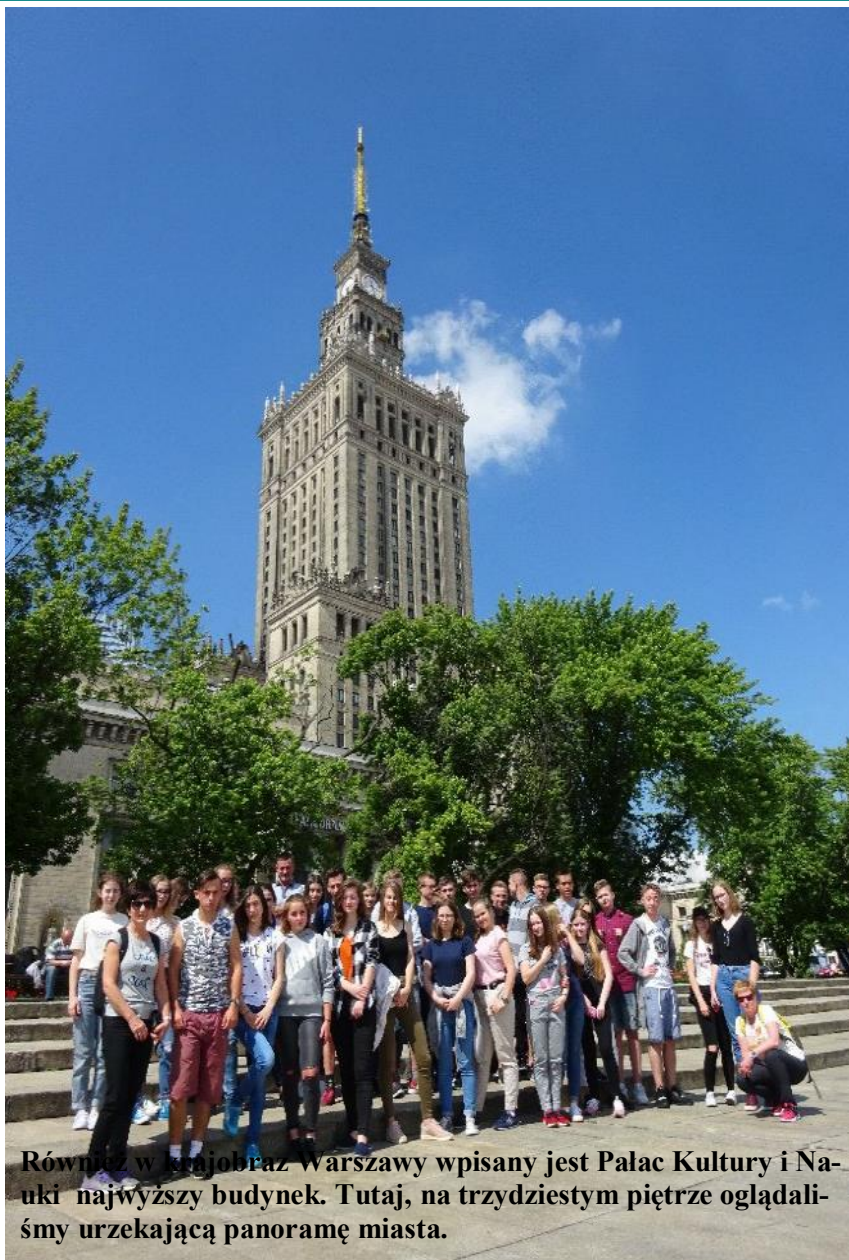
Również w ten obraz Warszawy wpisany jest Pałac Kultury i Nauki najwyższy budynek. Tutaj, na trzydziestym piętrze oglądaliśmy urzekającą panoramę miasta.